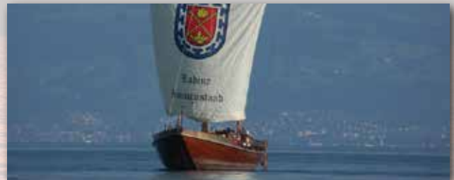
Lädine St. Jodok